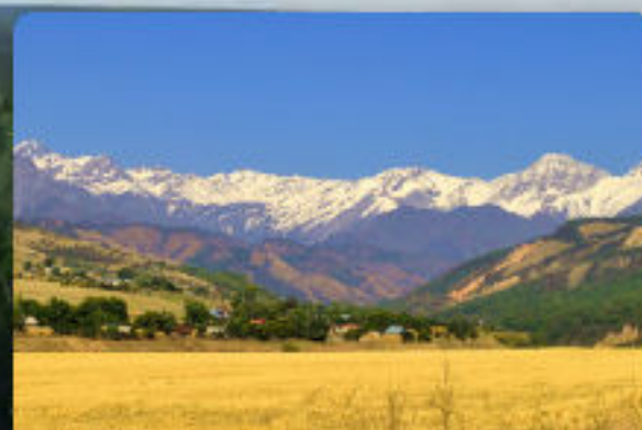
РАЗВИТИЕ FSC В СТРАНАХ СНГ