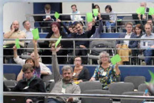
FSC КАК ЧЛЕНСКАЯ ОРГАНИЗАЦИЯ