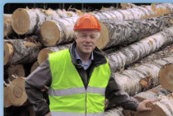
ПРИВЕТСТВЕННОЕ СЛОВО РУКОВОДСТВА FSC РОССИИ