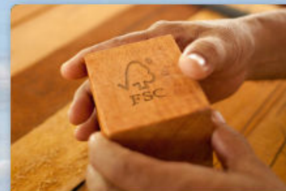
РАЗВИТИЕ РЫНКОВ СПРОСА FSC В 2016-2017 ГОДУ