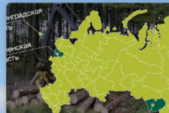
ДИНАМИКА РАЗВИТИЯ FSC В РОССИИ В 2016 ГОДУ