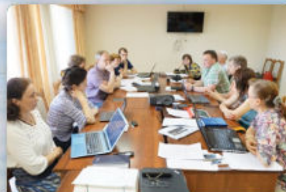
ОБНОВЛЕНИЕ СТАНДАРТОВ В 2016 ГОДУ